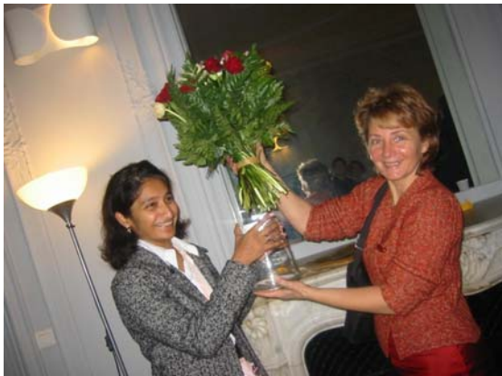
Petit déjeuner, créatrices accompagnées par Paris Pionnières, le 15 novembre 2005

Chaque mois, Paris Pionnière organise pour les créatrices des ateliers sur des thèmes touchant à la création d'entreprise.