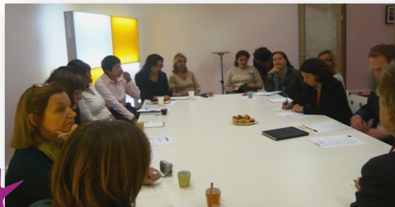
Les partenaires européens du programme Senior Competence reçus chez Paris Pionnières le 24 septembre 2008.

MCB : Nous devons accompagner 12 femmes cadres, porteuses d'un